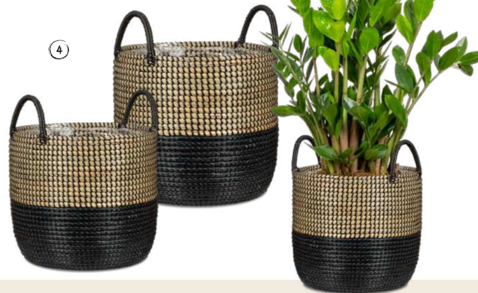
1 514 SEAGRASS WHITE SIZE 22, 26, 32, 36